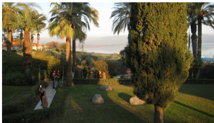
Utsyn fra Saligprisningenes berg. Her ser vi områdene der Jesus holdt Bergprekenen, der han mettet 5000, og der han gjorde flere av sine helbredelsesundre – i nærheten av hjembyen Kapaernaum nede ved Genesaretsjøen.

● Vi opplevde hvordan dette lille landet – med trusler fra nabostatene – klarer å skape trygghet både for sin egen befolkning og oss turister gjennom utallige og grundige